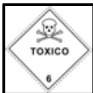
Rótulo peligro principal

Distintivo según NCh2190: Sustancias tóxicas (Clase 6, División 6.1)