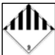
Rótulo peligro principal

Distintivo según NCh2190: Sustancias varias (Clase 9)